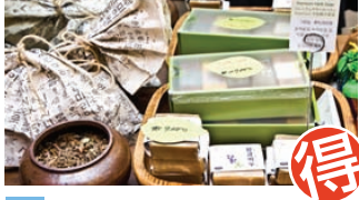
MAP B3 ハヌルホス ハヌルホス | 한늘호수

韓国コスメ通の間で話題の自然派ブランド 18種類の漢方を使った基礎ケア製品を扱うお店。 ボディからヘアケア、石鹸などお肌と体にいいものたくさん!