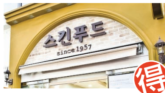
MAP B4 SKIN FOOD スキンフード | 스킨푸드

リーズナブルでおいしいコスメ! 肌に栄養とうおいを与えるロイヤルハニーラインが乾 燥からお肌を守る。他にも肌においしいようなコスメが豊 富。