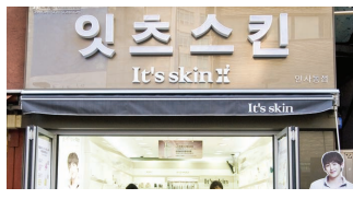
MAP B3 It's skin イツスキン | 잇츠 스킨

肌の専門家が処方したクリニカルスキン ソリューション ビタミン配合エファクターなど肌のお悩み解決に効果的な 成分を配合した商品が充実。ぜひ店員さんに相談してみてください!