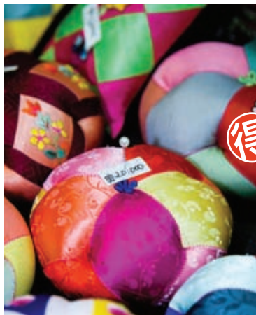
MAP B3 セロバン セロバン | 세로방

美しい色合いの可愛い伝統工芸品が揃う 韓国らしい色合いのアクセや雑貨などハンドメイドの ぬくもりがあるお土産がたくさん! お財布や針山、風呂敷が人気商品。