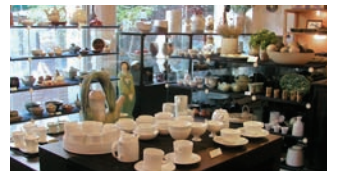
MAP B3 通仁カガ トインカガ | 통인가게

地下1階から6階までのギャラリー&ショップ 海外からの旅行者に人気のスポットで、伝統工芸の作品 展示会や家具・古美術品の展示販売がある。各階には各 言語対応スタッフがおり、海外配送も可能。