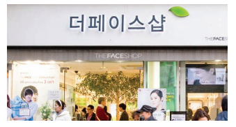
MAP B3 THE FACE SHOP ザ・フェイスショップ | 테페이스샵

100万個売れたキムヒョンジュンBBクリ ームはここで! BB以外にもスミムシリーズやエコセラビーが人気。 ネイルやグロスなどカラーメイクアップ商品も充実。