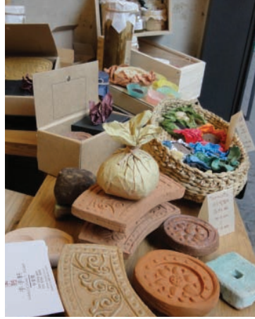
MAP B3 古間齋 コウンジェ | 고은재

サムジギル1階にあるオーガニック手作り 石鹸の店 有機農素材を使った石鹸は自然の香りが生きたこだわりの 品。1ヶ月以上熟成させて作られるので敏感肌にも安心! マッコリ石鹸などは海外からの旅行者にも人気。