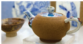
MAP A3 イ・セオン陶芸 イセヨントウゲイ | 이세용도예

色鮮やかなものからシンプルものまで全て 手作りの素敵な陶磁器 1点物の手作り現代陶磁器が並ぶ陶磁器屋さん。 日本でもコレクターがいるほど人気があるのだそう。