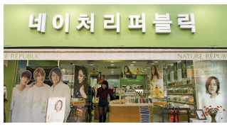
MAP B3 NATURE REPUBLIC ネイチャーリパブリック | 네이처 리퍼블릭

保湿系製品が充実なコスメブランド。 KARAがモラルを誇る自然派コスメブランド。 肌タイプ別アクアクリームやコラーゲンアンプルが売れ筋。