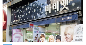
MAP B4 baviphat バビベツ | 바비벳

ビヨンセプロデュースのお店が仁寺洞にも! パッケージがアメリカンでかわいい! 塗って寝る睡眠パックや、マスカラ、ポーチがおすすめ。